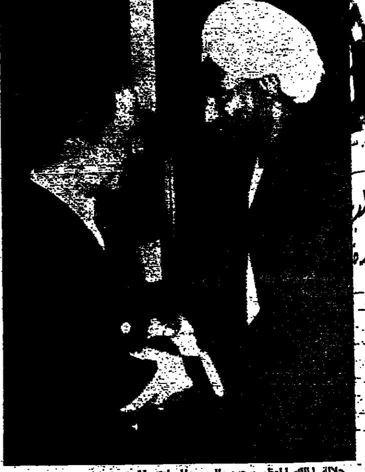
جلالة الملك المعظم يجيب بالسيد المصطفى الهادي رئيس حزب البعث السوري

الحسين للسعودية اليوم وزير بلخوة يوم السبت عمان - « الدستور » من مصادر وثيقة الاطلاع ان جلالة الملك الحسين المعظم سيقيم اليوم بزيارة الى المملكة العربية السعودية تستغرق يومين . كما علمت « الدستور » ان السيد بهجت القلوني رئيس الوزراء سيكون في معية جلالة الملك بهذه الرحلة . وتقول هذه المصادر ان موضوع مؤتمر القمة الخامس والاربعون في الشرق الاوسط ستكون في قمة الابحاث التي ستجري خلال هذه الزيارة . واذاع راديو صوت العرب مساء امس ان جلالة الحسين سيقيم بزيارة للجمهورية العربية المتحدة يوم السبت القادم تستغرق يوما واحدا يجري خلالها محادثات مع الرئيس جمال عبد الناصر .